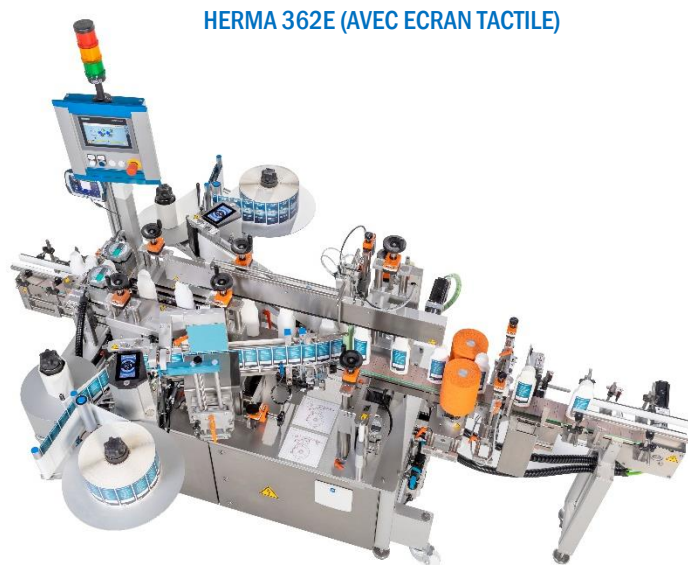
HERMA 362E (AVEC ECRAN TACTILE)

HERMA 362C (SANS ECRAN TACTILE) HERMA 362E (AVEC ECRAN TACTILE)